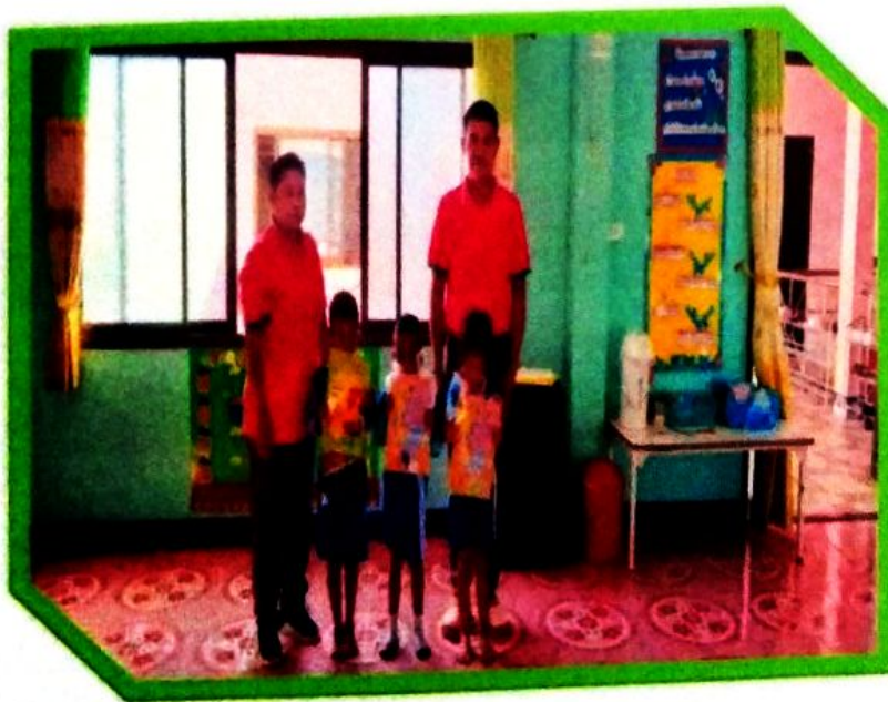
มอบรางวัลให้กับนักกีฬาที่โยนลูกบอลลงตะกร้าได้มากที่สุด