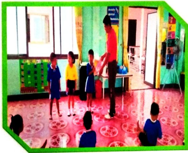
มอบรางวัลให้กับนักกีฬาที่เตะฟุตบอลเข้าโกล์ได้มากที่สุด