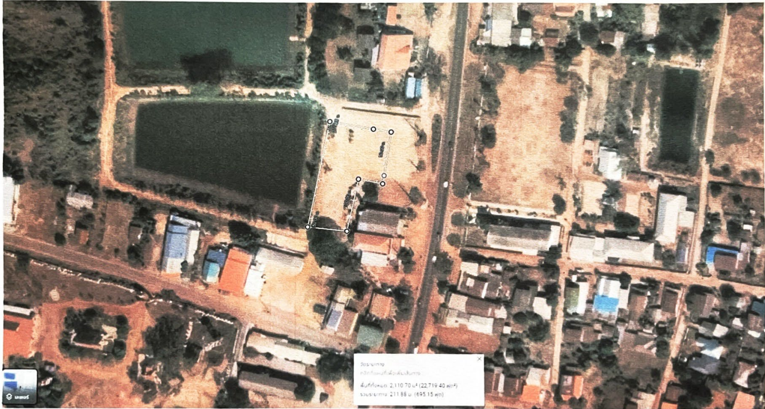
แผนที่ตลาด/ขนาดตลาด