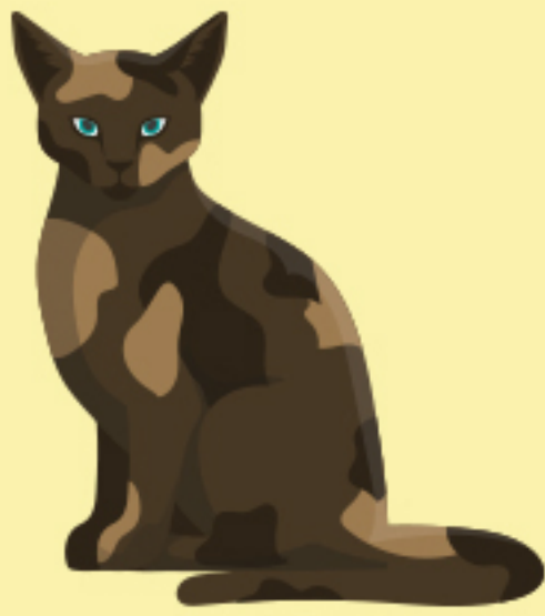
อันดับ 2 แมว