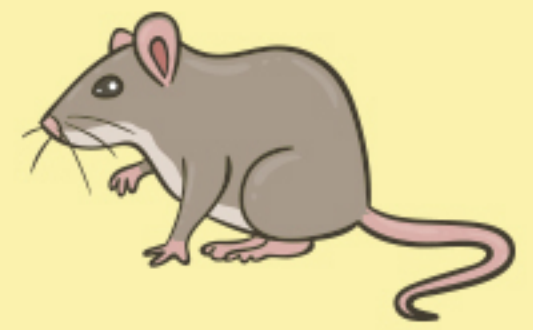
หนู อื่น ๆ